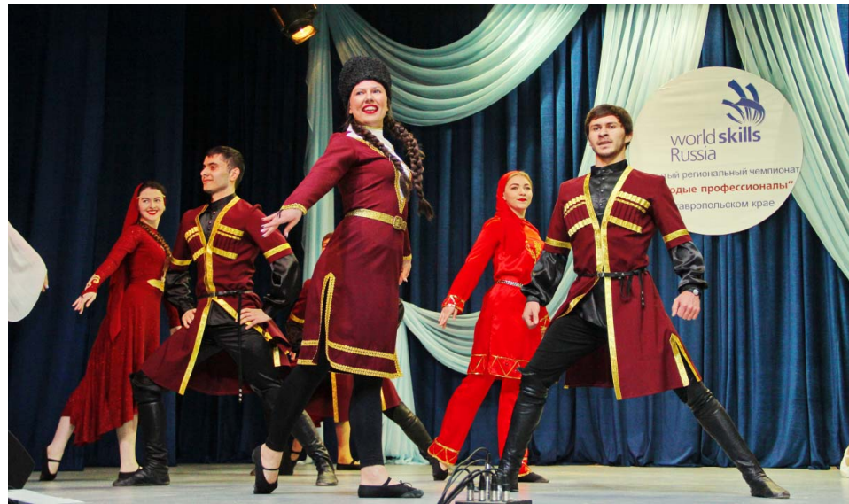
(На снимке: выступление народного коллектива - ансамбля кавказского танца "Барачет" НГГТИ (рук. А. Антипова) на закрытии Открытого регионального чемпионата WS.)

НАШИ ДОСТИЖЕНИЯ В рамках приоритетного национального проекта «Образование»