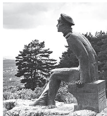
(На снимке: памятник М.Ю. Лермонтову, г. Кисловодск)

Я счастлив был с вами, ущелья гор; Пять лет пронеслось: всё тоскою по вас. Там видел я пару божественных глаз; И сердце лепечет, воспомян тот взор: Люблю я Кавказ!.. Михаил ЛЕРМОНТОВ