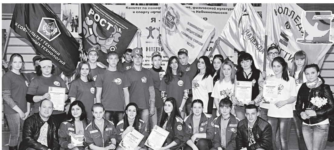
(Продолжение. Начало на с.1)

ся все более популярным, каждый месяц регистрируются его новые участники. Около 3-х тыс. добровольцев по зову сердца приходят на помощь, дарят тепло окружающим и живут активно и позитивно. Сегодня ни одно городское или краевое мероприятие не обходится без волонтеров.