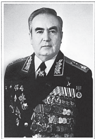
(на снимке из плаката: Герой Советского Союза, Маршал Советского Союза, Почетный гражданин г. Невинномысска В.Г. Куликов)

вого батальона, начальником отдельной танковой бригады. Звание ГСС присвоено в 1981 г. за большой вклад, внесенный в строительство Вооруженных Сил СССР, умелое руководство войсками, личное мужество и отвагу, проявленные в борьбе с немецко-фашистскими захватчиками.