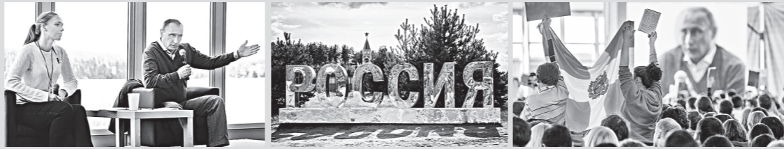
29 АВГУСТА 2014