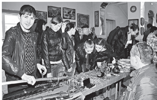
(Продолжение на с. 3)

Материалы подготовили Кирилл МАЛЕВАНЬИ, член Союза журналистов России, помощник депутата Думы г. Невинномыска Е. Жмайлова, Г. КОЗЛЮК, член Союза журналистов России