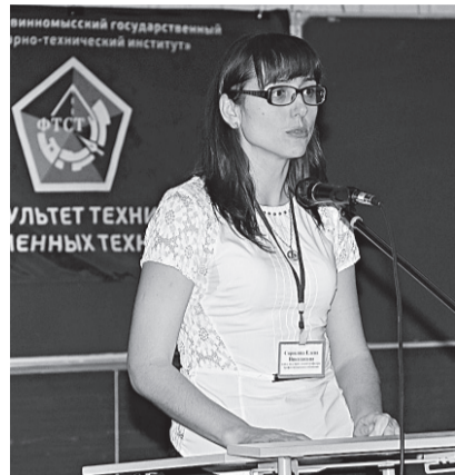
Невинномысский государственный про-технологический институт